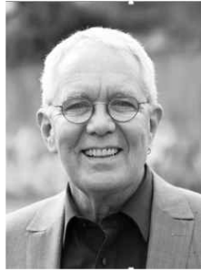
Thomas v. Erlach www.mmi-bildung.ch