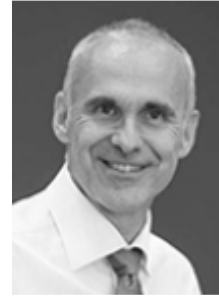
Willy Wölfli www.azu-bildung.ch